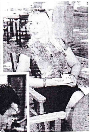
Nîmes is ook culinair een absolute aanrader.