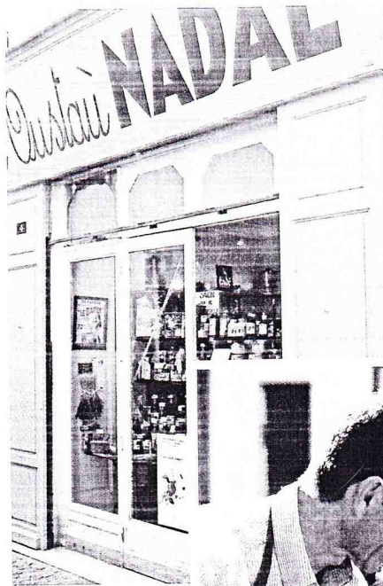
Winkel vol olijfolie, 4, rue des Marchands.